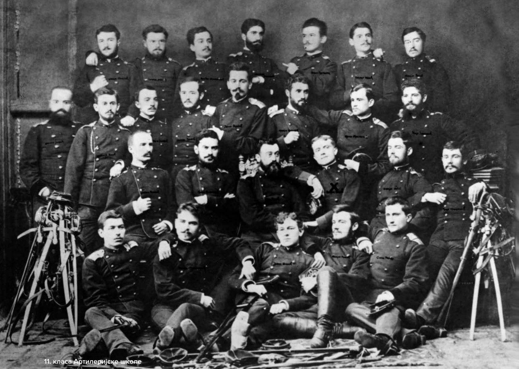
11. класа Артиљеријске школе