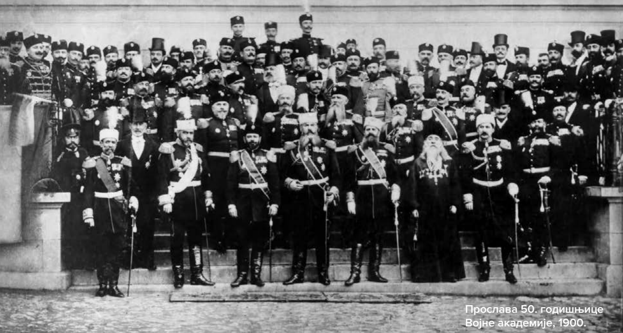
Прослава 50. годишњице Војне академије, 1900.